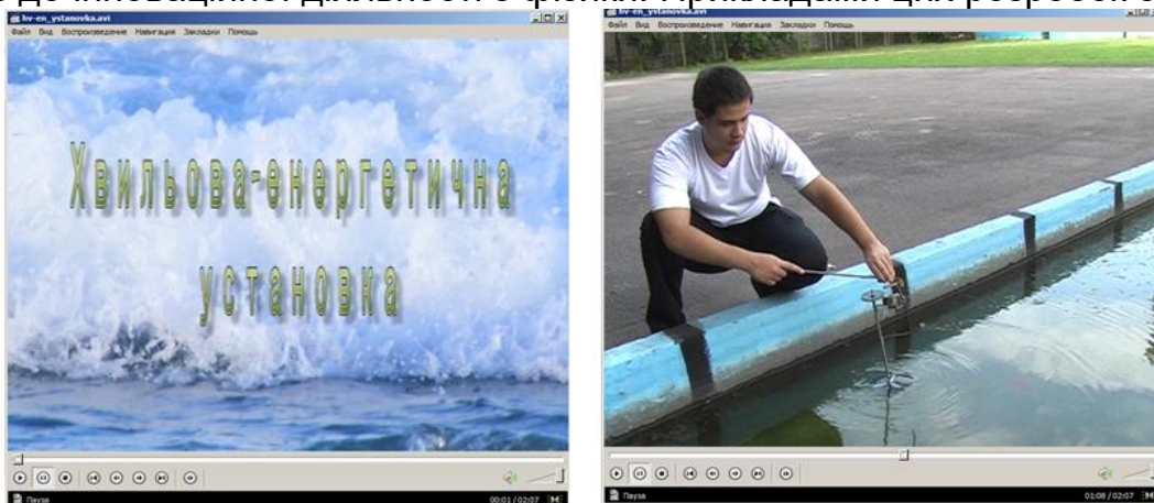
Рис. 3. Кадри навчального відеофільму “Хвильова енергетична установка”

Розроблення та впровадження інформаційних продуктів в освітній процес (блок 3 на рис. 1). Цей блок пов'язаний, насамперед, зі створенням, апробацією та впровадженням у процес професійної підготовки майбутніх учителів фізики нових інформаційно-комунікаційних продуктів, що сприяють активізації їх інноваційної діяльності та постають ефективними засобами, що уможливають у подальшому залучення учнів до інноваційної діяльності з фізики. Прикладами цих розробок є: