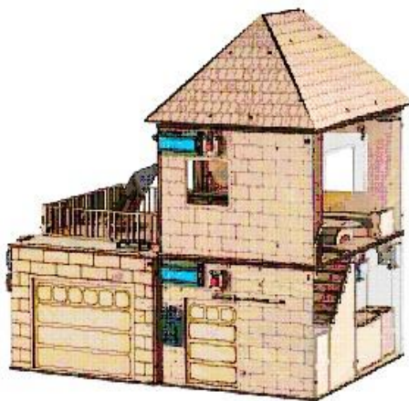
Рис. 1. Модульний STEAM-набір SMART HOME

Результати та дискусії. Як приклад, розглянемо STEM-проект, що можна виконати на основі модульного набору «Розумний будинок», який пропонує ТОВ «Mirroschool» (ТОВ «Mirroschool», 2021). Метою технологічного STEM-проекту «Розумний будинок» є зацікавлення учнів та студентів інноваційними технологіями, природничо-математичними дисциплінами, розвиток критичного мислення, вміння практичного застосування науково-технічної інформації, формування компетентісного підходу та професійної мобільності, мотивування до свідомого вибору майбутньої професії.